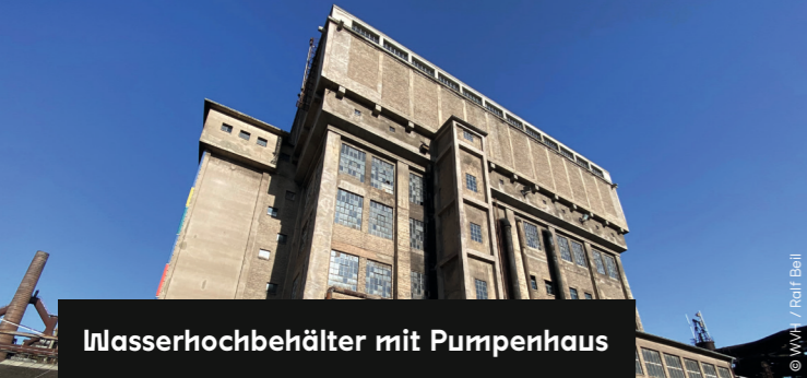
Wasserhochbehälter mit Pumpenhaus