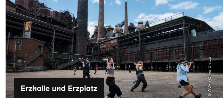
Erzhalle und Erzplatz

Nichts sollte ungenutzt verloren gehen: Daher wurden die Reststoffe des Verhüttungsprozesses in Völklingen gesintert. Durch starkes Erhitzen wurde der gesammelte Erzstaub zu etwa faustgroßem Material zusammengebacken und so wiederverwendbar gemacht. Auch hier dachte man in großen Dimensionen: Die Sinteranlage von 1928 war damals eine der größten in Europa. Heute ist das Gebäude einer unserer Schlüsselorte für die Präsentation historischer Zusammenhänge: Im Zentrum steht das Mahnmal der Erinnerung an die Zwangsarbeiter, gestaltet vom Weltkünstler Christian Boltanski, hinzu kommen weitere Kunstwerke, das Hüttenkino und zeitgeschichtliche Ausstellungen.