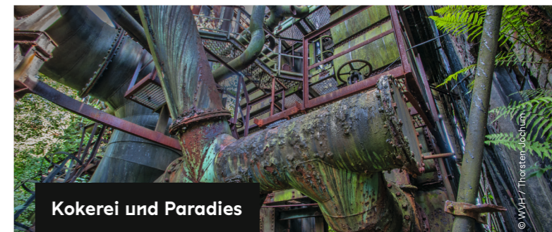
Kokerei und Paradies

Die Trockengasreinigung ist eine originär saarländische Innovation. In den drei Trockengasreinigungen, entstanden 1911 bis 1922, wurde das Gichtgas der Hochöfen durch Baumwollschläuche gesaugt. Erzstaub und Koksreste blieben dort hängen. Das gereinigte Gas konnte vielfältig weiterverwendet werden: zum Antrieb der Gebläsemaschinen und von Dynamos, für die Winderhitzung, in der Sinteranlage und in der Kokerei. In einem äußerst aufwendigen Prozess wurden diese historischen Anlagen von Schadstoffen gereinigt und gesichert. Nun wird dieses Meisterwerk der Technikgeschichte inklusive Hochofen-Leitstand für unsere Besucher:innen zugänglich gemacht.