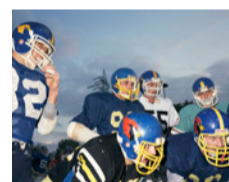
American Football I