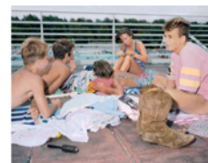
Piscine extérieure III