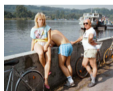
Tour à vélo I