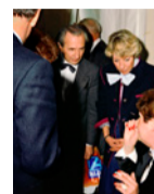
Anniversaire d'un collectionneur d'art I - III