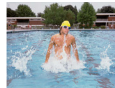
Piscine extérieure I