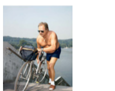
Tour à vélo II