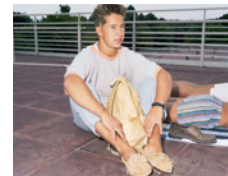
Piscine extérieure II