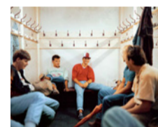
American Football II